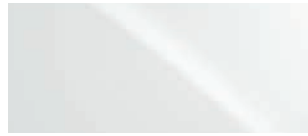
ULTRA BLANC 0083