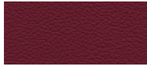
CUIR DE PREMIÈRE QUALITÉ - PERFORÉ CUIR F SPORT