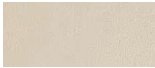
CUIR DE PREMIÈRE QUALITÉ - PERFORÉ