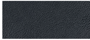
CUIR DE PREMIÈRE QUALITÉ - PERFORÉ CUIR F SPORT