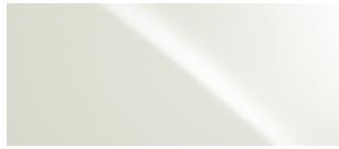
BLANC STELLAIRE NACRÉ 0077