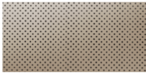
CUIR - PERFORÉ