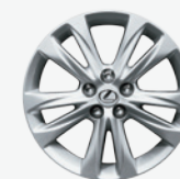
Roues de 16 po en alliage à 10 rayons – De série