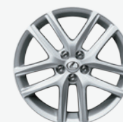
Roues de 17 po en alliage à 5 rayons divisés – En option