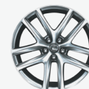
Roues de 17 po en alliage à 5 rayons divisés avec fini graphite liquide – F SPORT