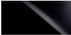
NOIR OBSIDIENNE 0212