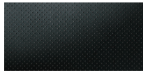
CUIR - PERFORATIONS BLANCHES