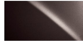
AGATE SOMBRE NACRÉ 04V3