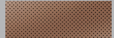
CUIR - PERFORÉ | LIN