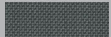
ARGENT | GARNITURES EN ALUMINIUM

Le toit noir est offert avec certaines couleurs extérieures sur la CT 2016 avec groupe F SPORT . Pour plus de détails, visitez le concessionnaire Lexus le plus proche ou Lexus.ca.