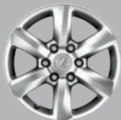
GX 460 Roues en alliage de 18 po à 6 rayons