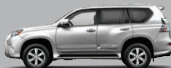
FILET D'ARGENT MÉTALLISÉ.....0114