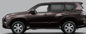
AGATE SOMBRE NACRÉ.....04V3