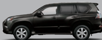
NOIR ZIRCON MICA.....0217