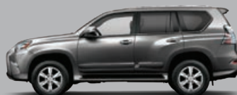
GRIS NÉBULEUX NACRÉ.....01H9