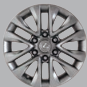
GX 460 Exécutif Roues en alliage de 18 po à 6 rayons divisés au fini graphite