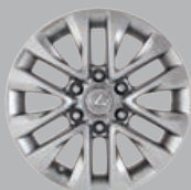
GX 460 Premium Roues en alliage de 18 po à 6 rayons divisés