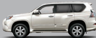
BLANC STELLAIRE NACRÉ.....0077