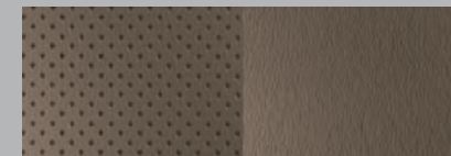
CUIR CUIR DE PREMIÈRE QUALITÉ - PERFORÉ | SÉPIA