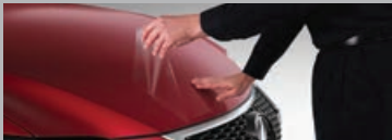
PELLICULE DE PROTECTION DE LA PEINTURE